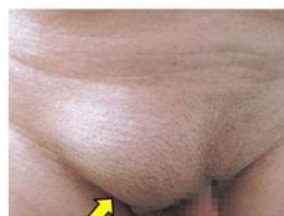
右鼠径(そけい)部の膨らみ(男性)

一般的にヘルニアと言えば、腰のヘルニア（椎間板ヘルニア）を思い浮かべるかもしれませんが、鼠径ヘルニアは俗に「脱腸」とも呼ばれますが、下腹部の足のつけねあたり（鼠径部）がポッコリとふくらむ病気です。外科の外来ではよくみられる一般的な