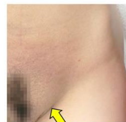
左鼠径(そけい)部の膨らみ(女性)

病気で、日本では年間約 15 万人の方が治療を受けています。先天的な原因で鼠径ヘルニアとなることもあるため、子供にも多い病気ですが、後天的な原因では 60 歳以上で発症することが多い病気です。男性に発症することが多いですが、女性にも発症し 10~20%の患者さんは女性です。